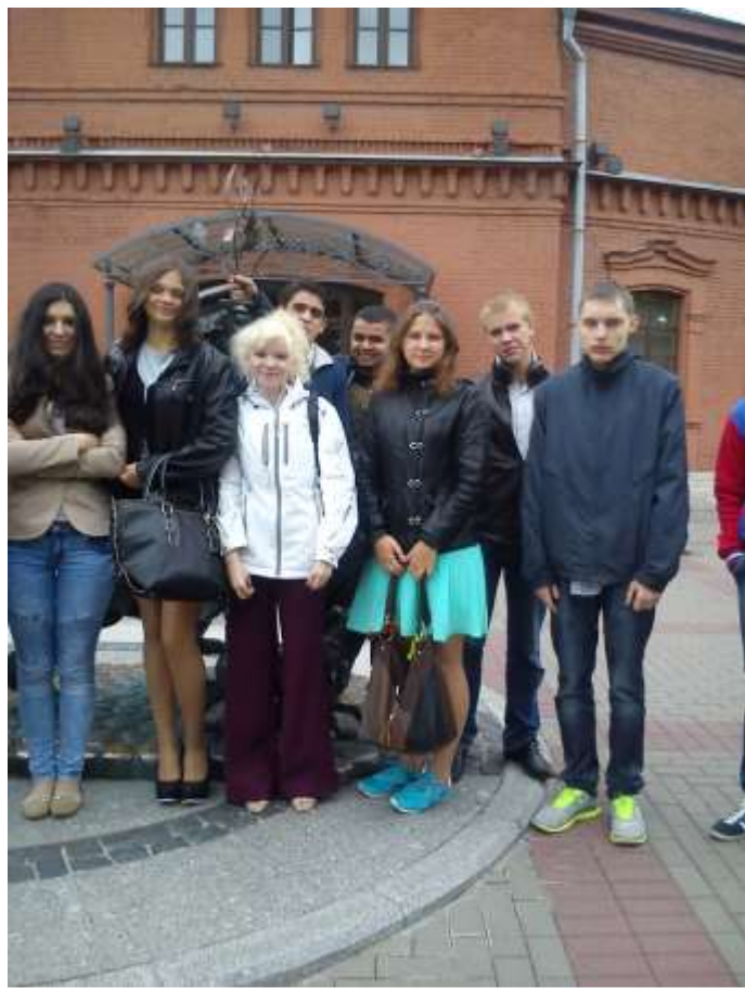
Экскурсия на Гуп "Водоканал"