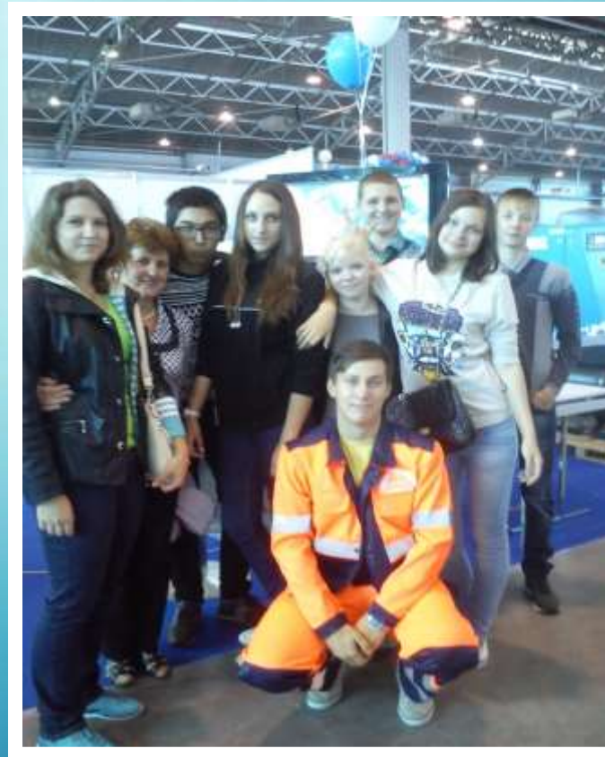
"Шаг в профессию" экскурсия в Ленэкспо