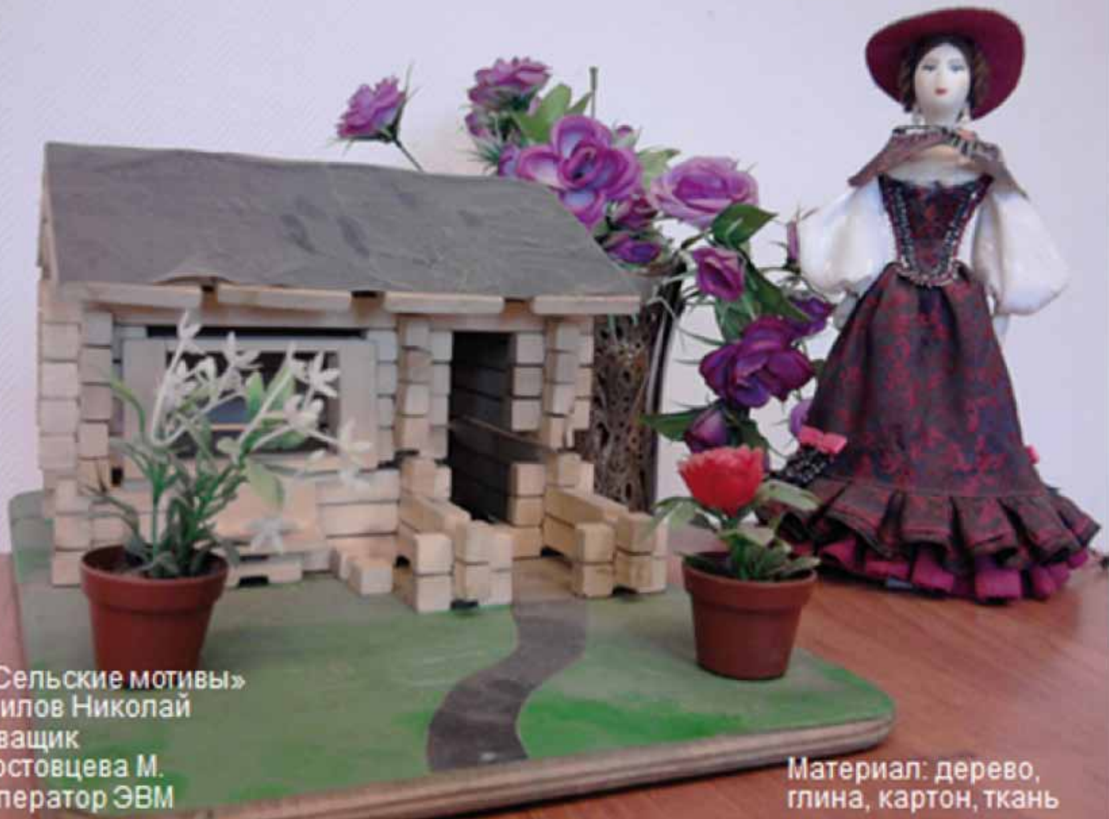
«Сельские мотивы» Шилов Николай Сващик Ростовцева М. Оператор ЭВМ