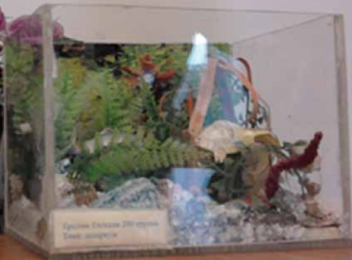
Материал: бумага, пластик