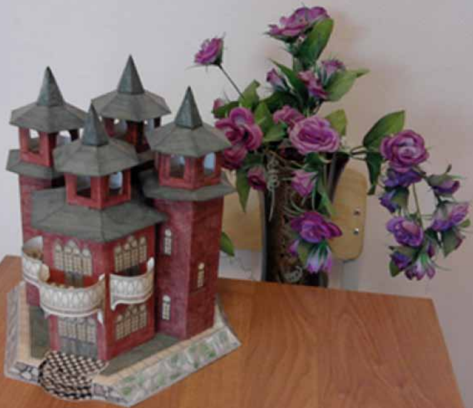
«Замок» Раскумандрина М. Оператор ЭВМ