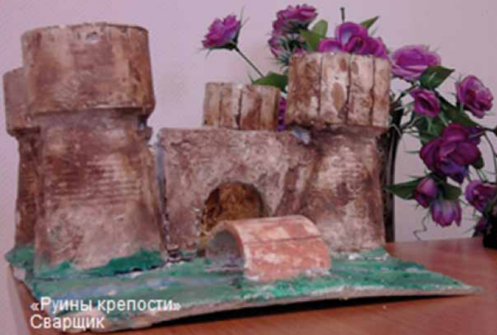
«Руины крепости» Сварщик