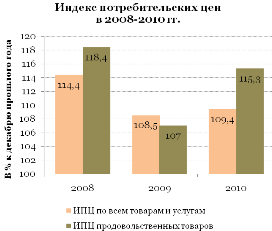
Рис.1. Динамика индекса потребительских цен

Перед рисунком в тексте оставляют одну свободную строку.